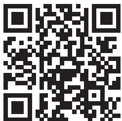
Standort Ignatianische Gemeinschaften

Wegweiser zu den Ständen auf Google-Maps